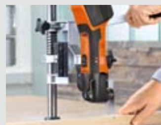
Werkplaats en modelbouw