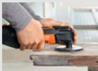
Ramen en deuren