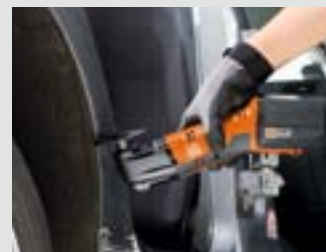
Rondom de auto