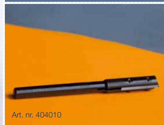
Art. nr. 404010

De HMB Sluitplaat is een maatvast gereedschap voor het perfect en snel infrezen van Sluitplaten en Sluitkommen. Het gereedschap bestaat uit een universele Moedermal. In combinatie met verwisselbare Inlegcassettes en een standaard Bovenfreesmachine, is het mogelijk om allerlei soorten Sluitplaten en Sluitkommen binnen enkele minuten uit te frezen.