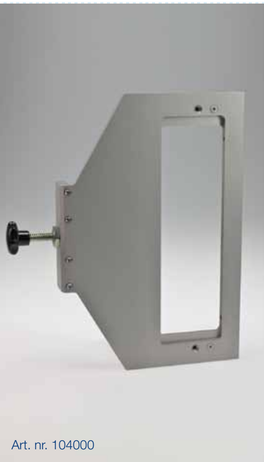
Art. nr. 104000